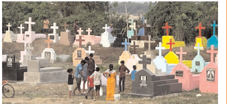
తాళ్లపూడి, వజ్ర భారతి ఏప్రిల్ 4: క్రైస్తవులు జరుపుకునే సమాధుల పండుగ నిమిత్తం పలు గ్రామాల్లో వారి పెద్దల సమాధుల వద్ద శుభపరిచి రంగులు వేసే కార్యక్రమాలను చేపడుతున్న దృశ్యాలు దర్శన మిస్తున్నాయి. తాళ్లపూడి మండలం ప్రక్కీలంక గోధావరి నదితీరం లో గల సమాధులు కు బల్లిపాడు ఆర్ అండ్ బి రోడ్ ప్రక్క, మలకపల్లి లో ఆర్ అండ్ బి రోడ్ ప్రక్క పండుగ కోసం రంగులు తో సిద్ధం చేస్తున్నారు.