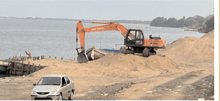
తాళ్లపూడి, వజ్ర భారతి ఏప్రిల్ 4: తాళ్లపూడి మండలం లోని బోట్ మెన్ సానైటీ ఇసుక ర్యాంపుల వివాదాలకు ఎట్టకేలకు తెరపడింది. వేగేశ్వరపురం లో పుట్టిన వైరం మిగతా ర్యాంపులకు పాకింది. చివరకు కొవ్వూరు లో పార్టీ పెద్దలు వివాదాలకు తెరపడేలా చర్యలు తీసుకోవటం తో కథ సుఖాంతం అయ్యింది. ప్రక్కీలంక, తాళ్లపూడి లో రెండు ర్యాంపులు తిరిగి ప్రారంభమయ్యాయి.