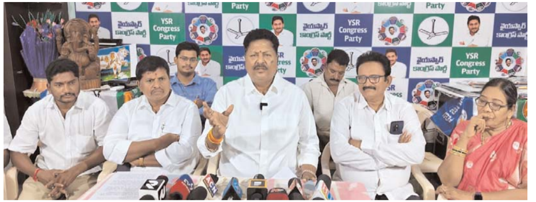
దేశంలో ఎక్కడా లేని కొరత ఏవీలే..