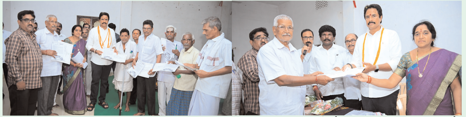
నేతనల్లకు విద్యుత్తు రాయితీ కల్పించిన ప్రభుత్వం